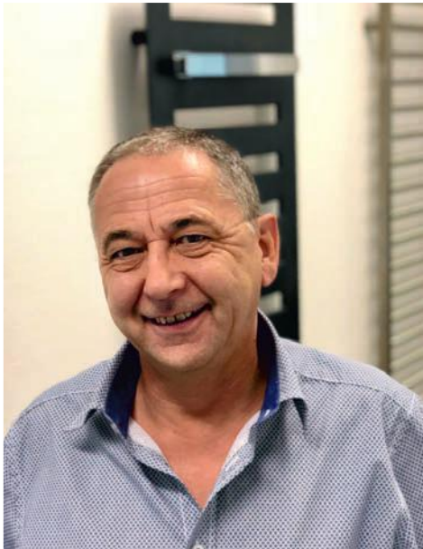
Günther Müller Heizungs- und Badplanung